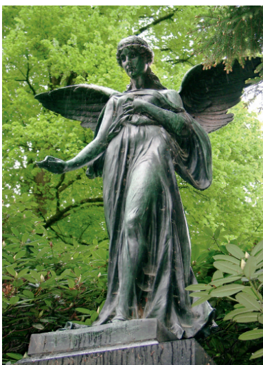
Ob Engel oder Trauernde – erotische Frauen be- völkern den Friedhof Ohlsdorf.

Äußerst beliebt sind Engel, die an die Nike von Samothrake bzw. an die Victoria erinnern. Wir kennen sie nicht nur von der Siegestsäule in Berlin, sondern