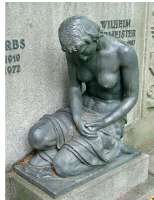
»Wer die Schönheit angeschaut mit Augen, ist dem Tode schon anheimgege- ben ...« August von Platen

senware, bei der man Details frei wählen konnte. Wie groß? Flügel ja oder nein? Und in der Hand? Eine Rose, einen Kranz oder einen Palmwedel? Gegen Aufpreis wurde die gewünschte Variante nur einmal pro Friedhof geliefert.